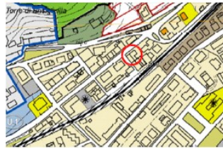
PLANIMETRIA FG. 59 - PART. 377 - SUB. 12