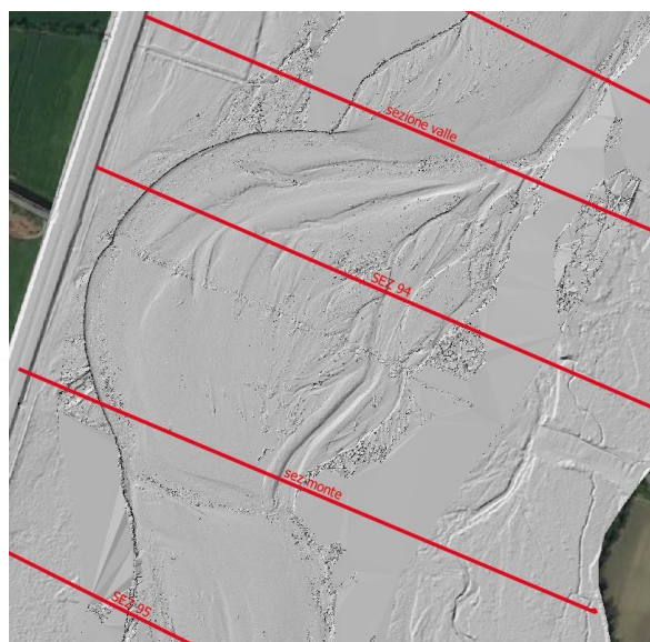
Figura 2 - DTM Lidar 16/07/2020 AdbPo

CHE tali studi definiranno le regole di gestione morfologiche della regione fluviale, anche al fine di contrastare i fenomeni di semplificazione morfologica riscontrati nel tratto di progetto, che originano problemi di natura idraulica, fornendo indicazioni e linee guida di progettazione ed intervento;