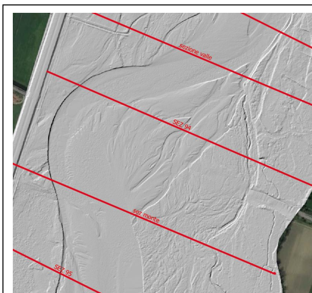
Figura 1 - DTM Lidar 2019 AdbPo

CHE dal confronto dei due rilievi 2019-2020 si evince un repentino avanzamento del fronte di erosione nell'ultimo anno, pari a 20 m (vedi Figura 1 e Figura 2);