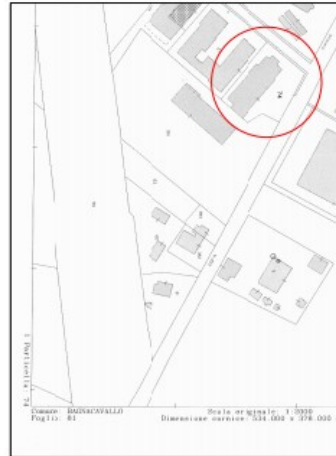
ESTRATTO DI MAPPA Foglio 81 - Mappale 74

Ogni diritto di copia è vietato per legge, quindi documenti appartengono allo Studio Tecnico Dal Borgo & Gimini