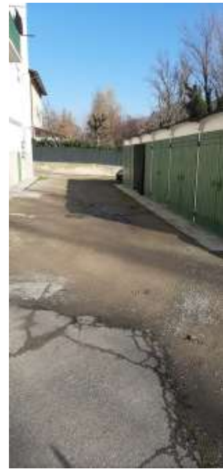
foto 3) stato dei luoghi al 08/12/20221 in loc. Calderino in sponda sinistra del t. Lavino a Monte San Pietro (BO)