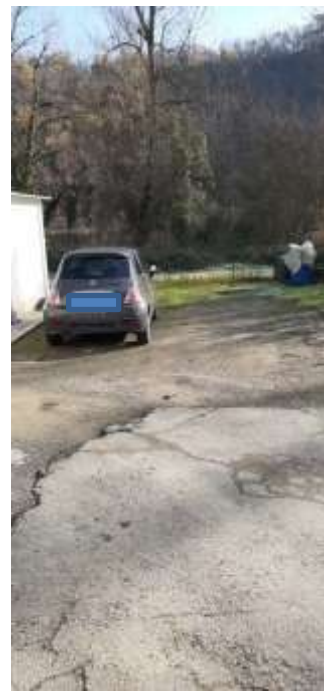
foto 6) stato dei luoghi al 08/12/20221 in loc. Calderino in sponda sinistra del t. Lavino a Monte San Pietro (BO)