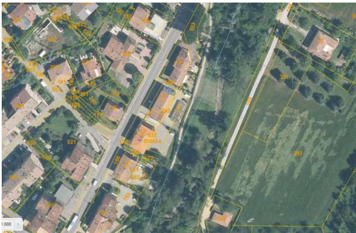
Figura 1) Fotopiano con individuazione dell'Area, oggetto del sopralluogo, e di richiesta in concessione demaniale.

Viste le prescrizioni tecniche contenute nella concessione demaniale di cui alla Determina n.^ 15.718 del 13/11/2015 e dato atto che occorre procedere ad alcune modifiche del disciplinare precedentemente rilasciato in quanto: