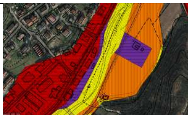
Figura 4) Direttiva Alluvione 2019 - l'area richiesta trovasi all'interno di un tessuto residenziale in classe di Danno D4 e classe di rischio R4 (aree in colore magenta)