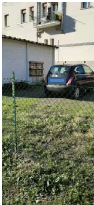
foto 5) stato dei luoghi al 08/12/20221 in loc. Calderino in sponda sinistra del t. Lavino a Monte San Pietro (BO)