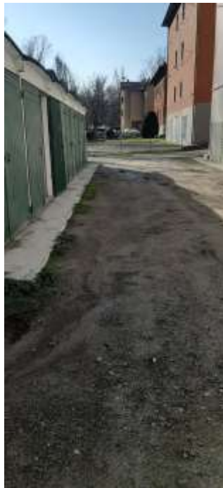
foto 2) stato dei luoghi al 08/12/20221 in loc. Calderino in sponda sinistra del t. Lavino a Monte San Pietro (BO)