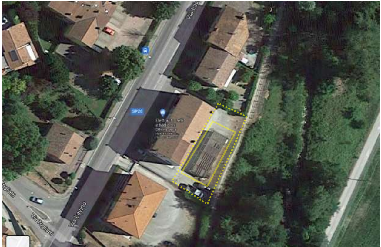
Estratto di mappa Google con individuazione aree occupate (linea tratteggiata in colore giallo).