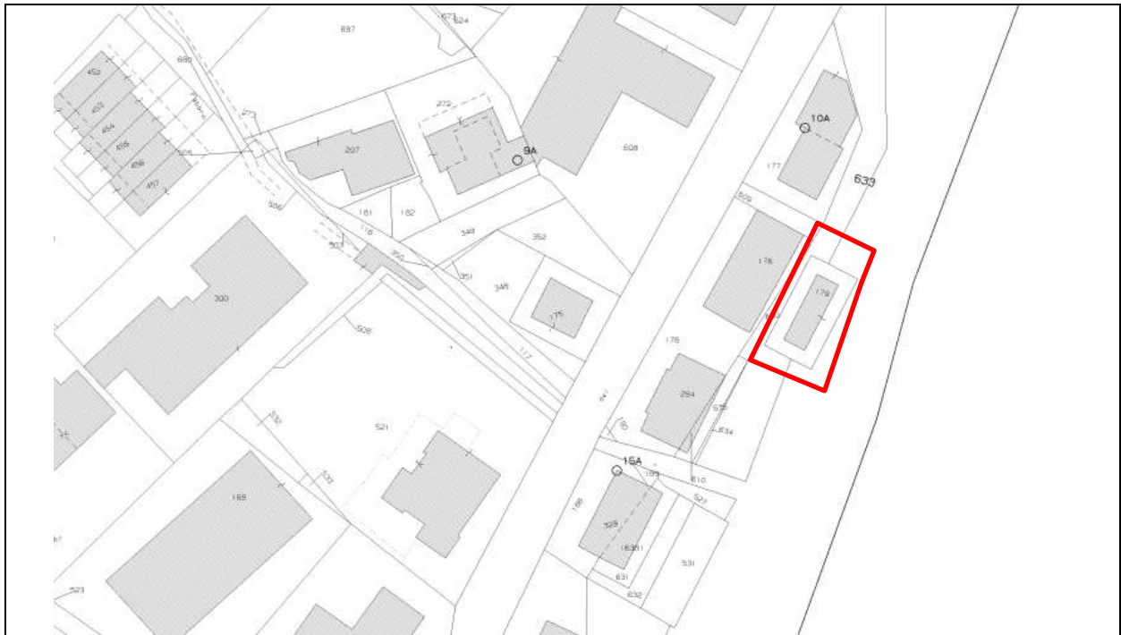
tavola 2) Estratto di mappa del Fg. 30 con indicata l'area demaniale occupata: parte del fg. 633 e parte del demanio idrico (n.c.) a meno del Fg. 30 mapp.179.