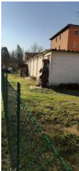
foto 4) stato dei luoghi al 08/12/20221 in loc. Calderino in sponda sinistra del t. Lavino a Monte San Pietro (BO)