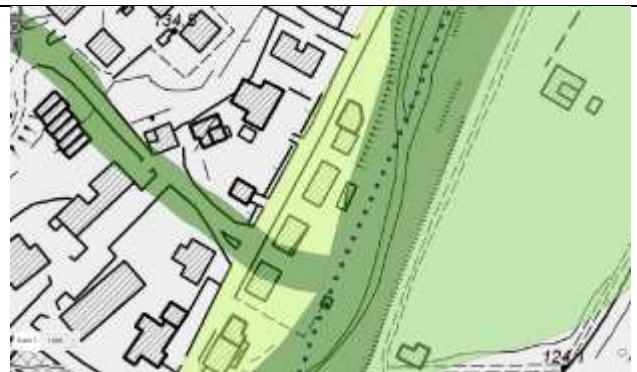
Figura 3 - PTCP con individuazione in colore verde scuro degli alvei dei corsi d'acqua (art. 4.2 delle Norme) e in colore verde chiaro delle Fasce di pertinenza fluviale (art. 4.4 delle norme) e in verde smeraldo le fasce di tutela fluviale come individuate dall'art. 4.3 del P.T.C.P.