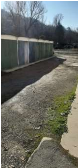
foto 1) stato dei luoghi al 08/12/20221 in loc. Calderino in sponda sinistra del t. Lavino a Monte San Pietro (BO)