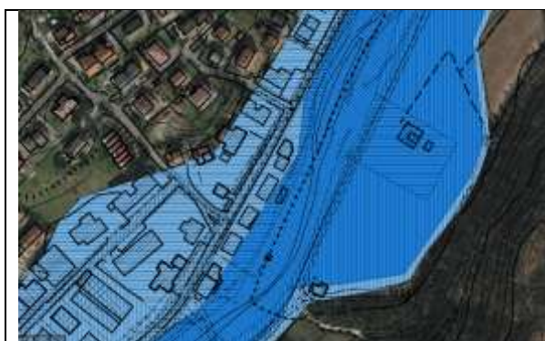
Figura 3) Direttiva Alluvioni 2019 - Scenario di Alluvione H_P3 in colore celeste scuro le aree ad alluvioni frequenti.