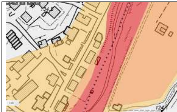
Figura 2 - PSAI con individuazione delle aree ad alta probabilità di inondazione in colore rosso e in colore arancio (art. 16 delle Norme di Piano).