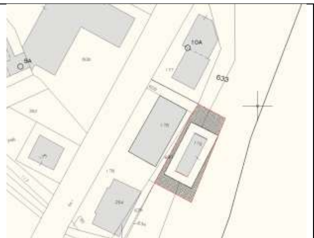
tavola 4) Situazione rilevata in data 26-01-2022 con individuazione delle occupazioni demaniali per mq. 184