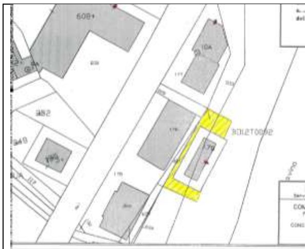
tavola 3) Rappresentazione delle aree demaniali richieste (mq. 154) come da planimetria allegata alla Determina di concessione n.^ 15718 del 13-11-2015