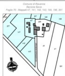
MAPPA CATASTALE scala 1:2000