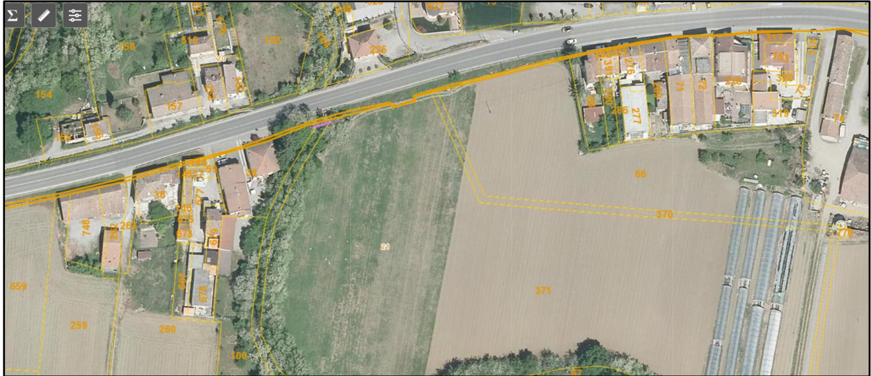
Vista area oggetto di intervento di attraversamento collegamento condotta acquedotto Rottofreno-Castel San Giovanni.