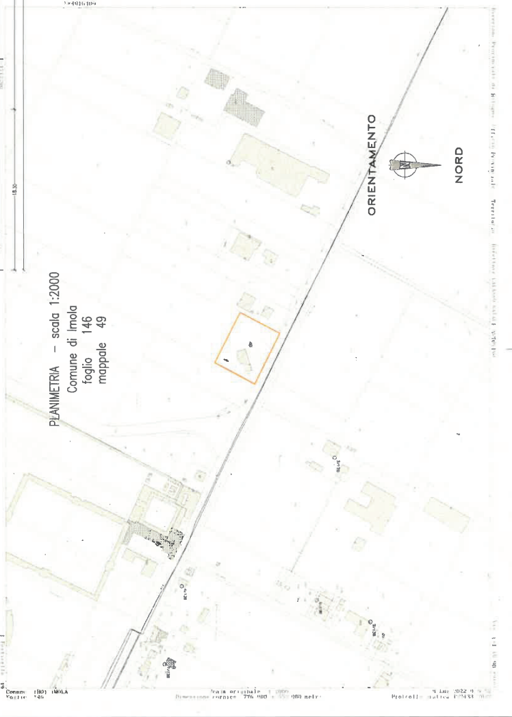
PLANIMETRIA - scala 1:2000 Comune di Imola foglio 146 mappale 49

LEGENDA SCHEMA TORNAIO Rete acque bianche Rete acque di fognaggio