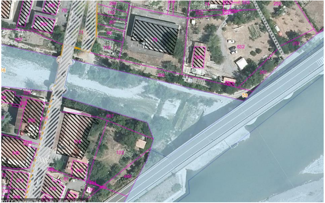
PLANIMETRIA ESTRATTA DA MOKA – DIR.ALLUVIONI