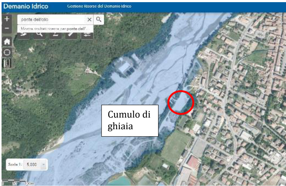
Area di deposito del cumulo di ghiaia