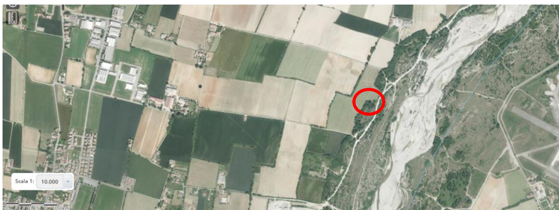
Zona oggetto di concessione Borgallo da piantumare