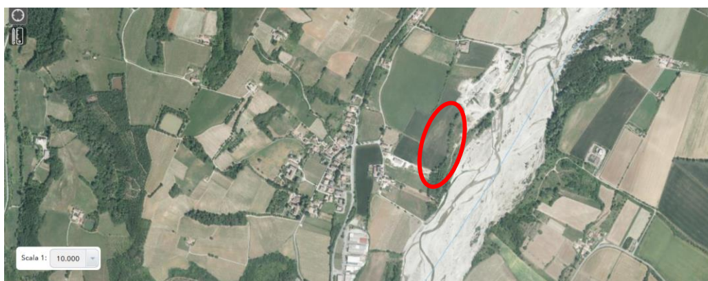
Zona oggetto di concessione Follazza da coltivare