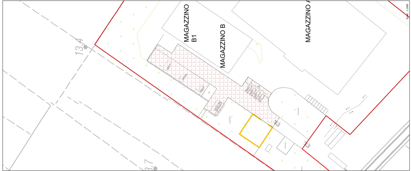
Esatto perimetro dell'area oggetto di modifica di AUA