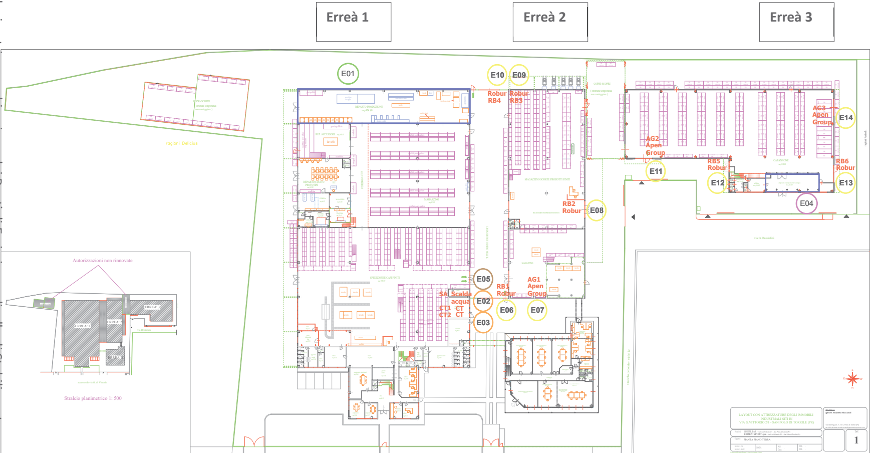
Figura 1: Planimetria con ubicazione dei Punti di Emissione a livello di Stabilimento