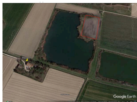
Dettaglio Particella 57 (Lago 2)

L'impossibilità di risalire a soggetti giuridicamente attivi è confermata dalla carenza di informazioni storiche o evidenze documentali antecedenti al 1971 e dalla cessazione della personalità giuridica di tutti i soggetti rintracciati in visura storica nel periodo immediatamente successivo ai conferimenti, determinando l'interruzione del nesso di causalità giuridicamente rilevabile.