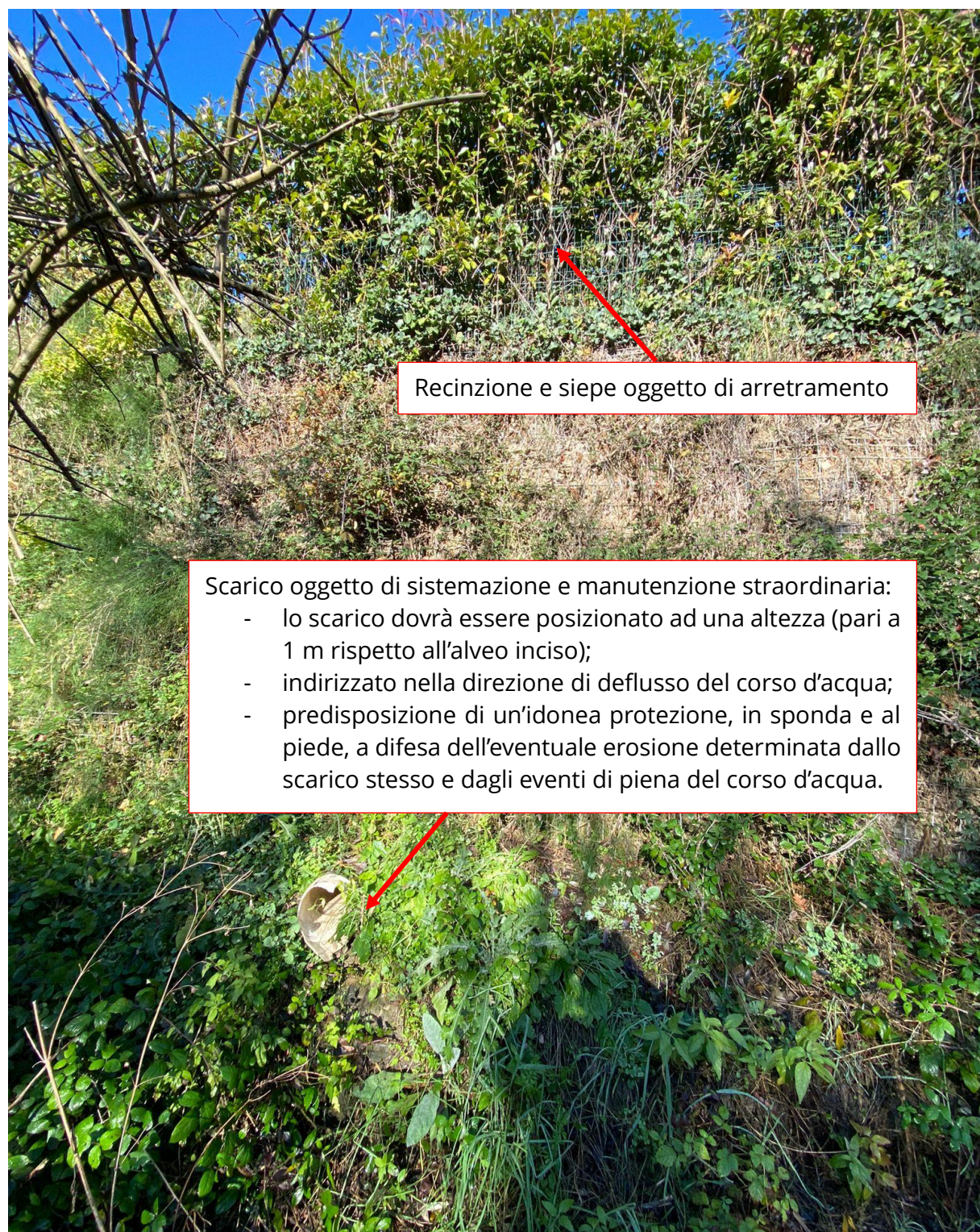
Figura 2. Particolare scarico acque e difesa di sponda