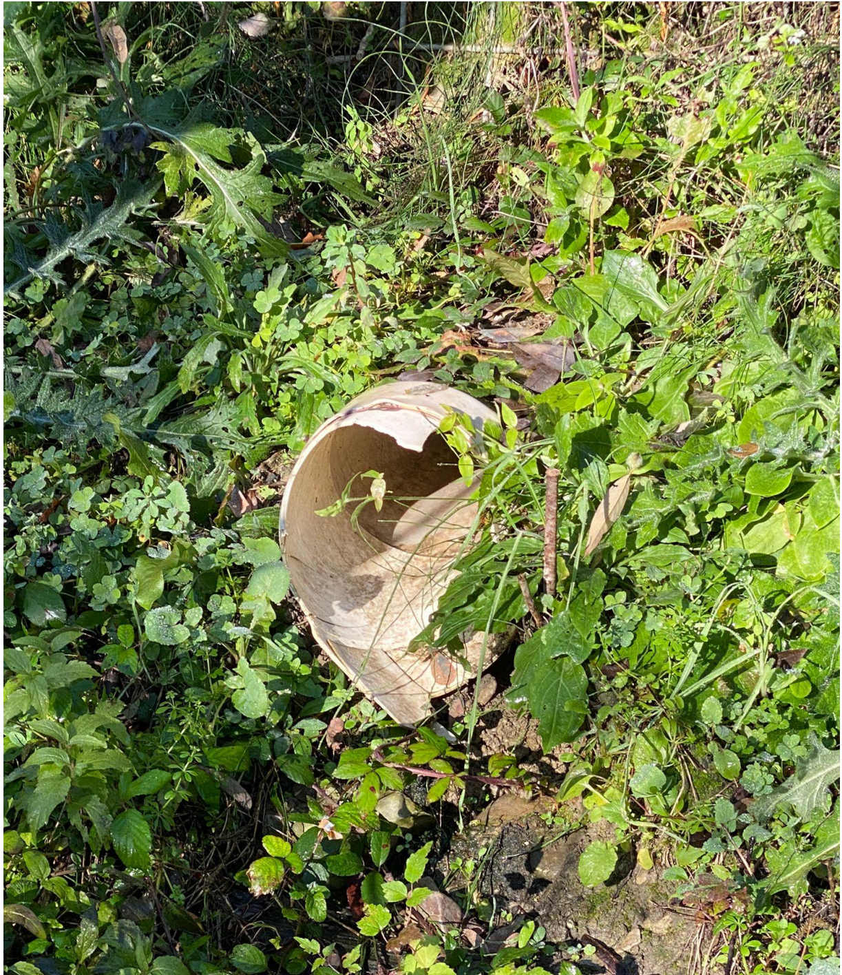
Figura 3. Dettaglio scarico con diametro DN200 mm (oggetto di manutenzione e sistemazione)