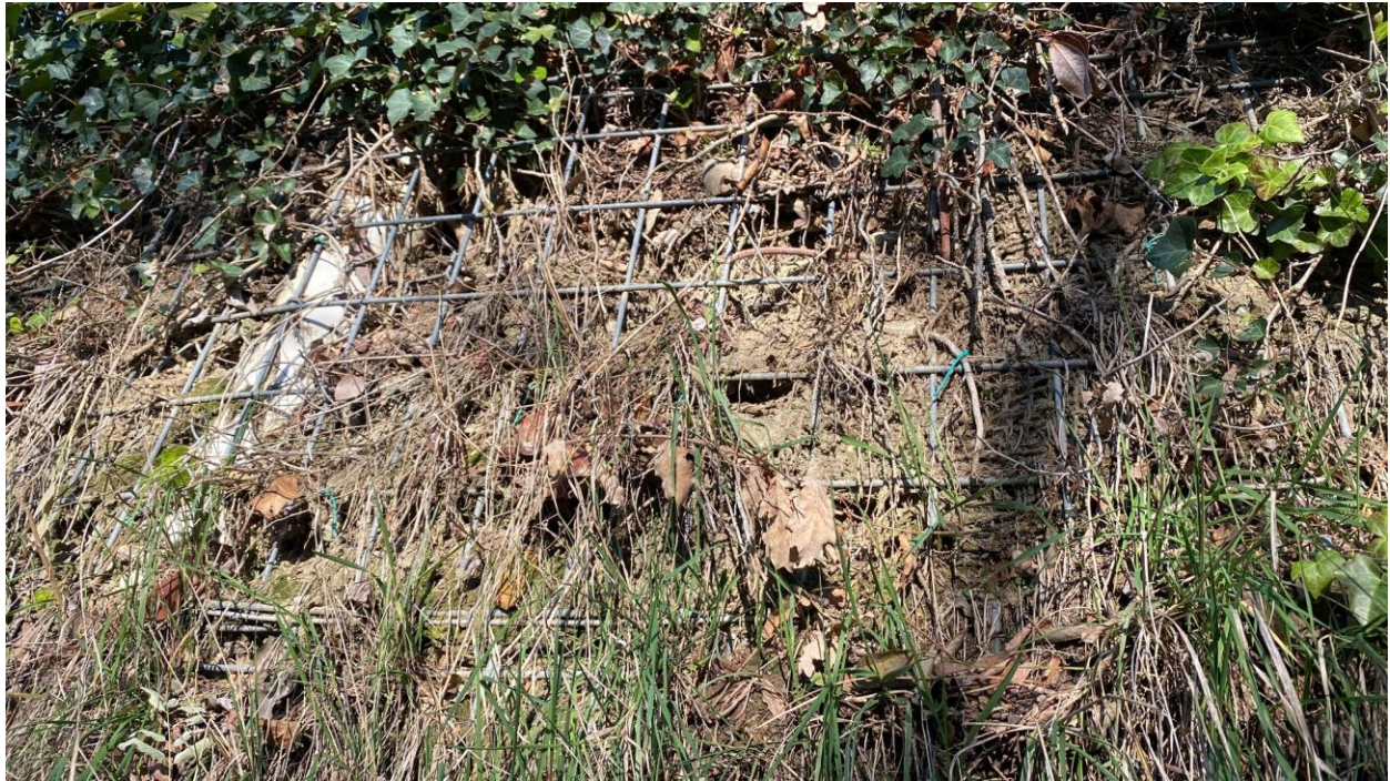
Figura 5. Dettaglio opera di sostegno (Terre Armate)