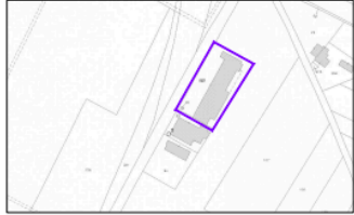
ESTRATTO DI MAPPA CATASTO TERRENI Comune di Cotignola Foglio 27 - mappa n. 92

©' verbatim la riproduzione totale o parziale del presente progetto a tutela dei diritti d'autore. Tutti i diritti sono riservati.