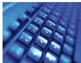
IT & Soluzioni Digitali IT & Digital Solutions