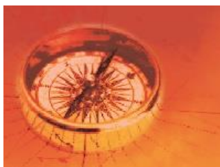
Consulenza di Direzione Management Consulting