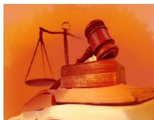
Sistemi di Gestione QHSE & Energy