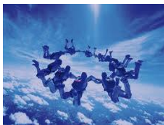
Formazione Manageriale Human Resources & Training